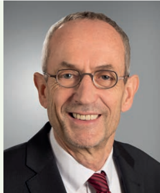
Willfried Wallbrecht Erster Bürgermeister