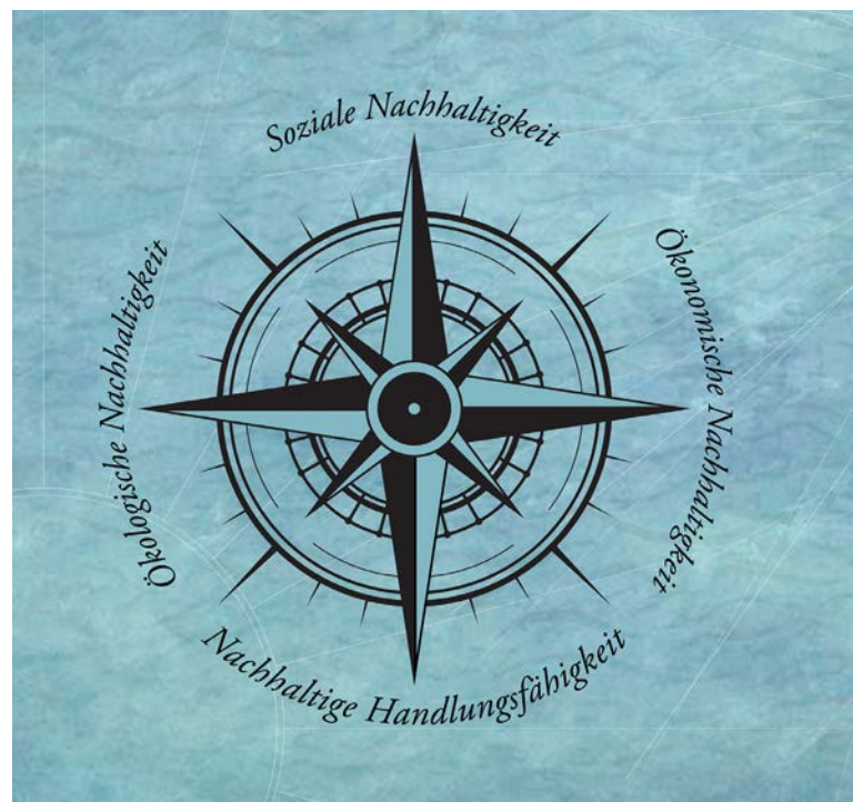
Abbildung 2: Strategischer Kompass für die Stadtentwicklung der Stadt Esslingen

Die vier vorgestellten Ziele bilden die strategischen Leitprinzipien der nachhaltigen Stadtentwicklung. Im Bild des Stadtkompasses bilden diese Prinzipien die vier Entwicklungsrichtungen, die von den städtischen Entscheidungsträgern in den Ausgleich zu bringen sind, um ein wirkungsvolles Navigieren mit dem Ziel einer nachhaltigen Entwicklung zu ermöglichen (vgl. Abbildung 2).